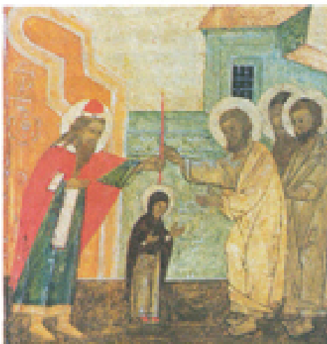
Обручение Марии прав. Иосифу. Клеймо иконы «Благовещение» из Благовещенского собора Сальвигогодека. XVI в.

была делом особого Промысла Божия. Она воспитывалась и училась вместе с др. девами, трудилась над пряжей и шила священнические облачения. Пищу буд. Богородице приносил ангел. «Обѣдъ стѣиъ свѣиъ, чѣстѣа во храмъ стѣиъ возвохѣа еси вселѣтѣса, и со агѣмъ, дѣво, вѣсѣдѣиши прѣвѣкѣиши, прѣлѣвѣиши еа нѣкѣи хѣбѣзъ прѣбѣиши, пѣ. тѣтѣмѣнѣица жѣизни» (тропарь 4-й песни