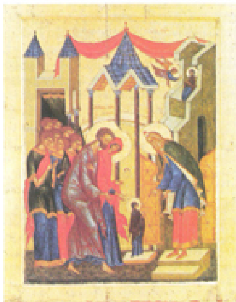
Введение во храм Пресв. Богородицы. Икона из праздничного ряда иконостаса Успенского собора Кирилло-Белозерского мон-ря. 1497 г.

с зажженными светильниками. «...Да ликоставятъ инокѣмъ со дѣвою, яко пѣвѣдъ стѣиъ изъ нѣкъ прѣзидѣ, маріа себѣтонѣс. наа, кѣбѣстѣннаа себѣца, и радѣтѣса ево. дѣри во храмъ...» (седален по полнелесе службы Введения). Родители поставили Ее на первую из 15 высоких ступеней храма. И здесь, по преданию, передаваемому блж. Иеронимом Спирidonским , свершилось чудо: Мария самостоятельно, без чьей-либо поддержки, взойдя по крутым ступеням, вступила в храм ( Нигем. De nativit. S. Mariae ). В тот же миг навстречу Ей вышел первосвященник: по преданию, Захария — буд. отец Иоанна Крестителя (Предтечи) . Он, по особому откровению Божию, ввел Марию во Святая Святых, куда имел право входить лишь 1 раз в году первосвященник. После этого Иоаким и Анна оставили Марию при храме. Вся Ее жизнь в храме